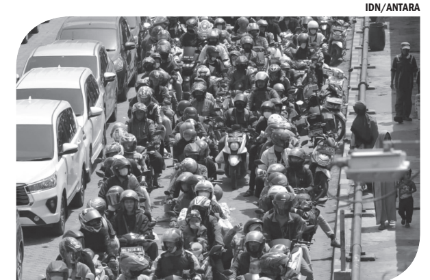
ARUS BALIK SEPEDA MOTOR PELABUHAN BAKAUHENI

Kendaraan dari arah Kota Serang menuju Anjer yang melintasi jalur ini diputar di Simpang Boru dan depan Kawasan Pusat Pemerintahan Provinsi Banten. Jika kemacetan menuju Anjer dari Kota Serang dan Pandeglang makin parah, kendaraan dialihkan ke arah Cilegon. ● pra