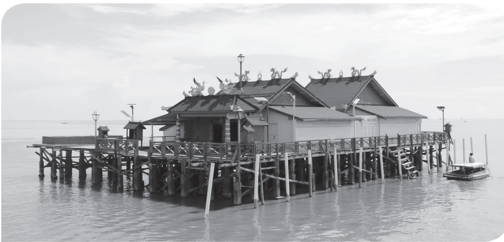
KELENTENG TERAPUNG DI TENGAH LAUT

Pemandangan Kelenteng Xiao Yi Shen Tang atau Dharma Bakti yang terapung di tengah laut Muara Kakap, Kabupaten Kubu Raya, Kalimantan Barat, Kamis (5/5). Kelenteng Xiao Yi Shen Tang yang telah berdiri sejak tahun 1969 di tengah laut Muara Sungai Kakap dan berhadapan dengan Laut Natuna tersebut menjadi salah satu destinasi wisata unggulan di Kabupaten Kubu Raya.